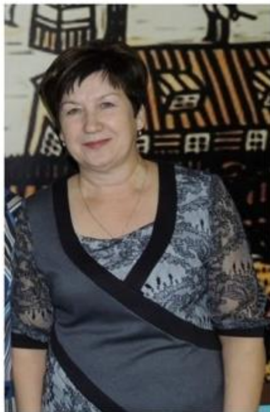
Л. Демченко - художественная обработка ткани