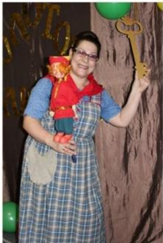
О. Фадеева - тряпичная кукла