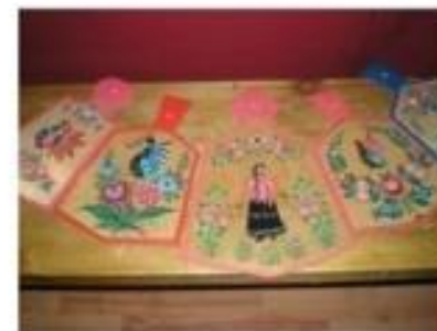
Изделия местных мастеров, предложенные туроператорам