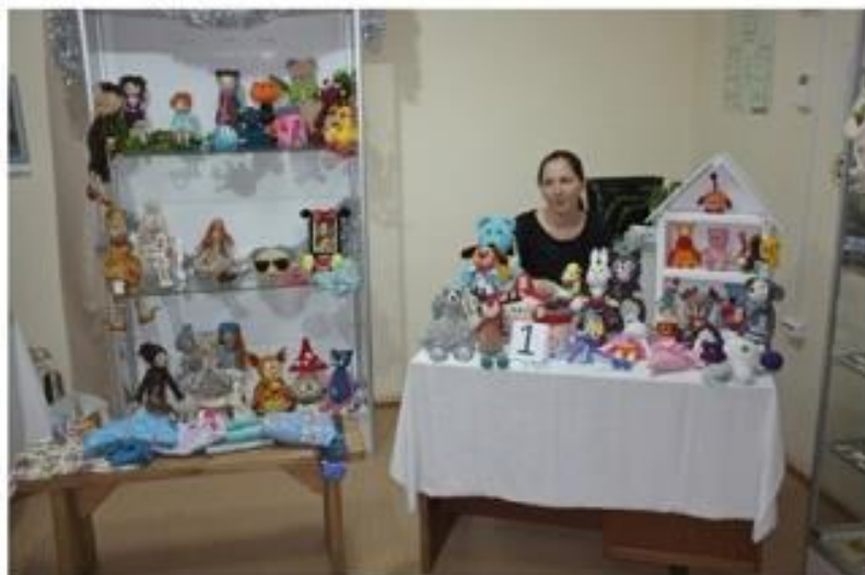
М. Калугина - вязаная игрушка