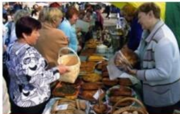
Изделия местных мастеров на Преображенской ярмарке